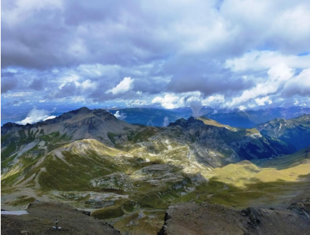
Unternehmensdaten in die Cloud geben?