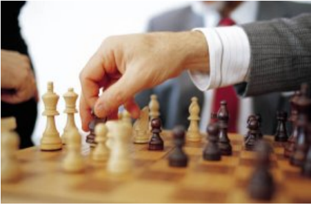
Die Strategieumsetzung ist die Kunst, Menschen und Unternehmen zum Erfolg zu führen